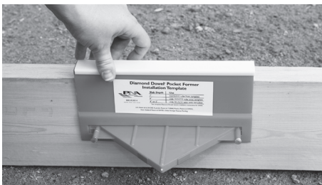
Plantilla de instalación Diamond Dowel®